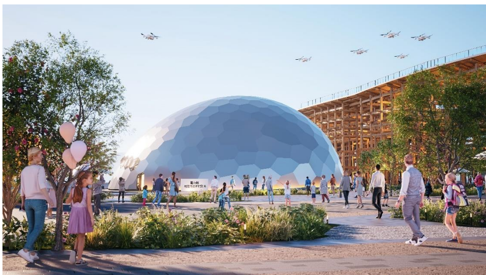
「電力館 可能性のタマゴたち」外観イメージ

※パビリオンの名称「電力館 可能性のタマゴたち」は、2023年10月4日お知らせ済み。