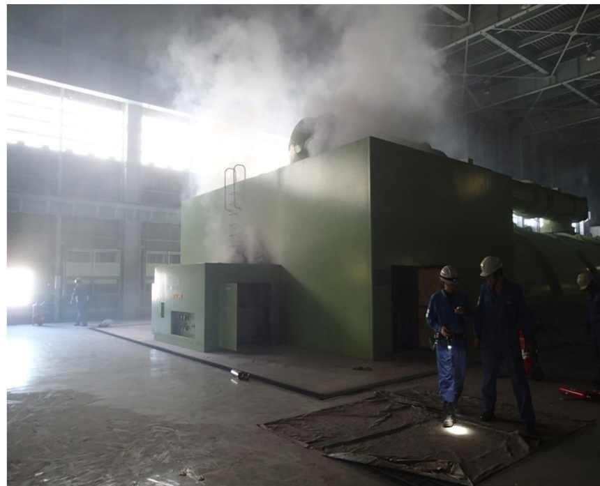
4号機 タービン出火直後