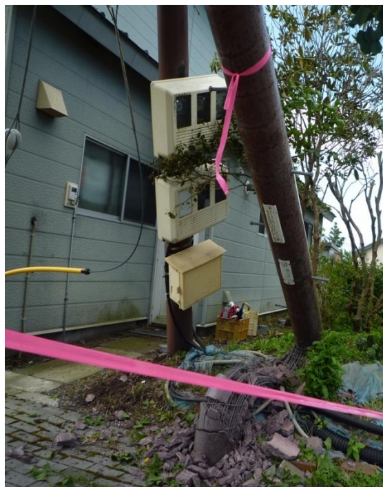
電柱折損・傾斜現場 (沙流郡日高町)