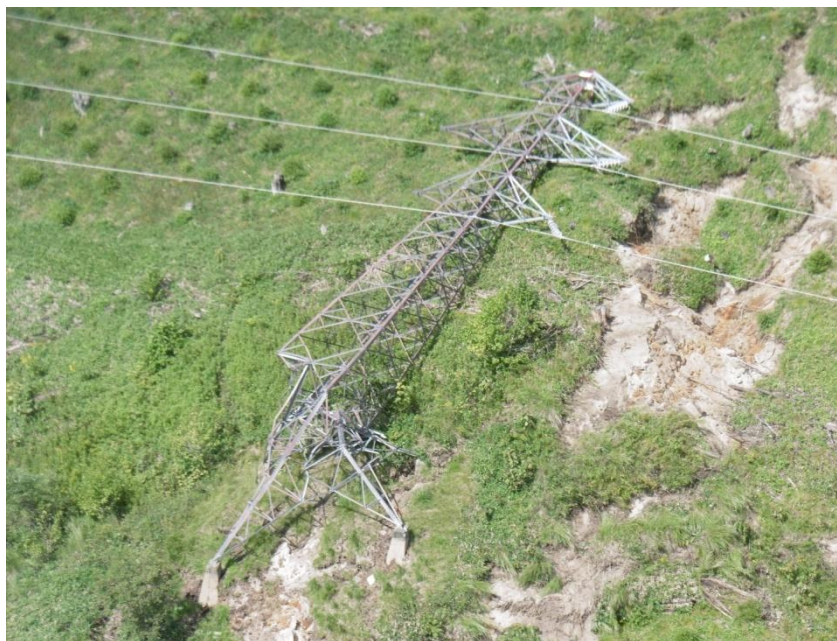
岩知志線 鉄塔倒壊現場 (勇払郡むかわ町)