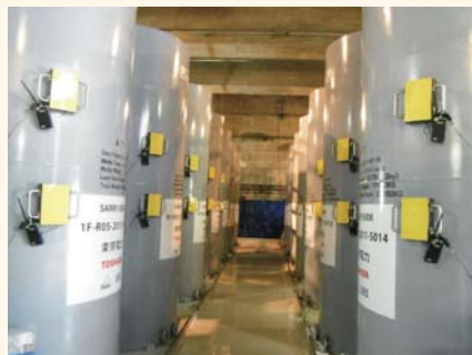
セシウム吸着装置

タービン建屋に溜まる高濃度汚染水の水位は、当面の目標レベル(小名浜平均潮位)から約3mの高さで安定しており、豪雨や汚染水処理システムのトラブルによってあふれ出す可能性は低い状態です。また、汚染水を処理して吸着したセシウムを一時的に保管する施設の運用も開始しました。