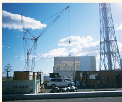
原子炉建屋上部の測定の様子

1～3号機からの放出放射能は11月時点で毎時6千万ベクレル以下となり、敷地境界の放射線量は年間0.1ミリシーベルト以下と、目標だった1ミリシーベルトを下回りました。放射性物質の飛散を防ぐため、原子炉建屋カバーを設置(1号機)するなどの対策も講じられています。