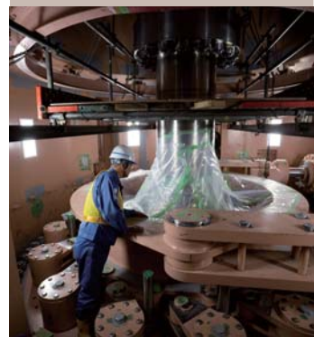
表紙写真:水をたたえる上部調整池 上写真:上部調整池(左上)と京極ダム調整池(右下) 下写真:工事が進む2号機のポンプ水車上部